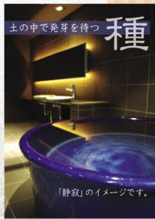
「静寂」のイメージです。