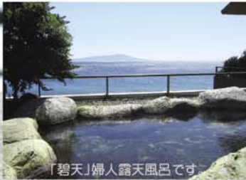
「碧天」婦人露天風呂です。