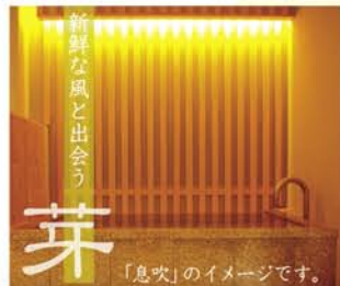
「息吹」のイメージです。