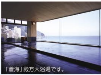
「蒼海」殿方大浴場です。

熱川館の温泉は、無色透明の弱食塩泉。神経痛や肩こり、慢性婦人病によく効く女性や高齢者に優しい天然温泉です。