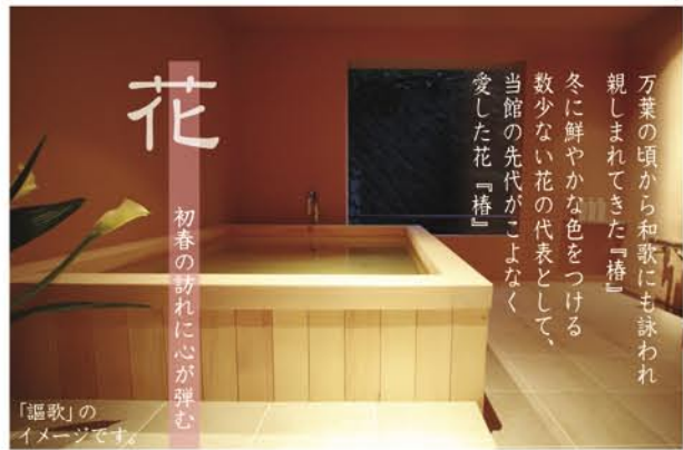
「謳歌」のイメージです。