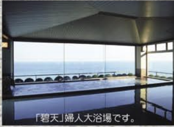
「碧天」婦人大浴場です。

自家源泉 「八幡の湯」 泉質：ナトリウム・塩化物・硫酸塩温泉 / 泉温：98.5度