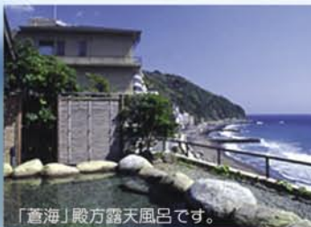
「蒼海」殿方露天風呂です。

熱川館の温泉は、無色透明の弱食塩泉。神経痛や肩こり、慢性婦人病によく効く女性や高齢者に優しい天然温泉です。