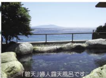
「碧天」婦人露天風呂です。