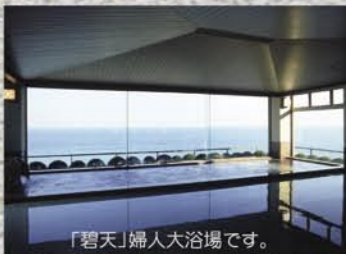
「碧天」婦人大浴場です。