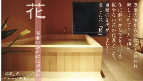
「謳歌」のイメージです。